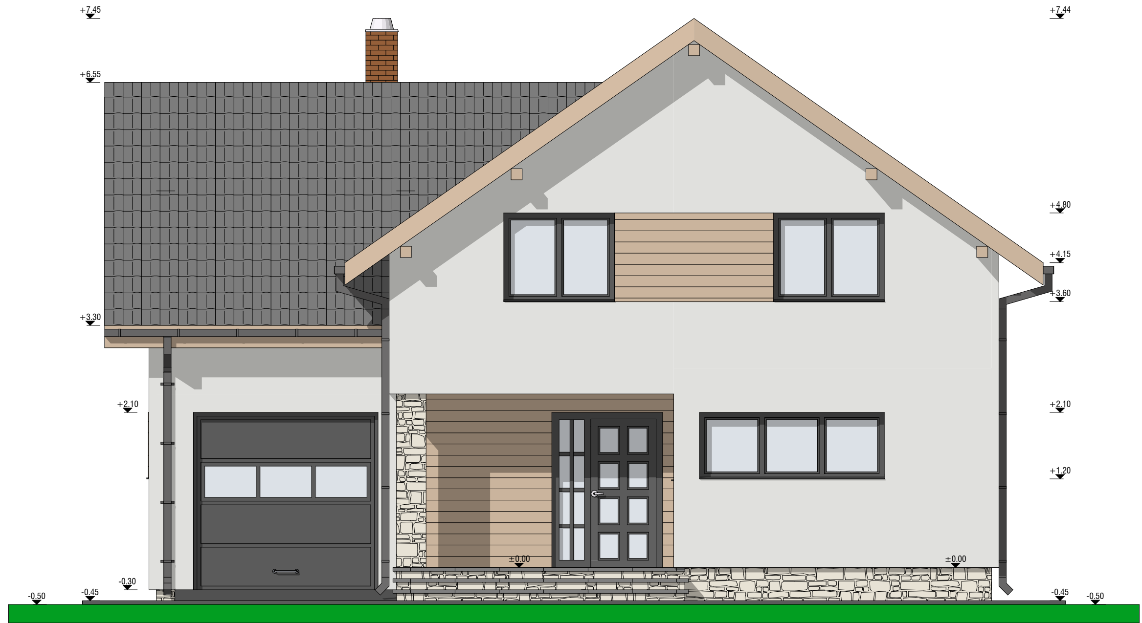
FATADA SUD-VEST (PRINCIPALA) SCARA 1:50

Invelitoare din tigla metalica, culoare "GRI antracit" - RAL 7016; Sistem pluvial (igheburii si burlane) din tabla vopsite in camp electrostatic, culoare gri; Tencuielei exterioare structurate pe termosistem, culoare alb-crem, placari cu scandura de lemn tratata si lacuita; Placari cu placi ceramice - imitatie piatra naturala, la soclu, culoare naturala; Tamplarie exterioara din PVC cu geam termoizolant, culoare "GRI antracit" - RAL 7016; Trepte placate cu gresie antiderapanta, culoare gri; Glatfuri exterioare din PVC, culoare "GRI antracit" - RAL 7016; Trotuar din b.s. turnat pe loc.